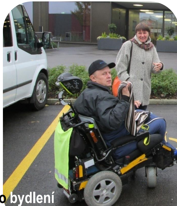
Vedoucí terénní služby podpora samostatného bydlení Pro Infirmis Thurgau-Schaffhausen