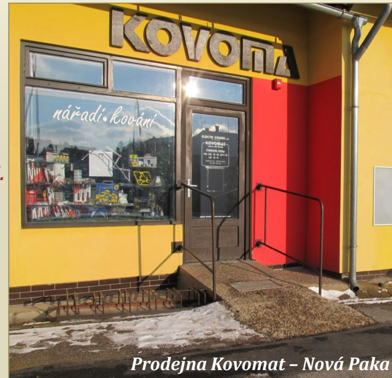
Prodejna Kovomat – Nová Paka

... Hledání jednoduchých a investičně nenáročných řešení