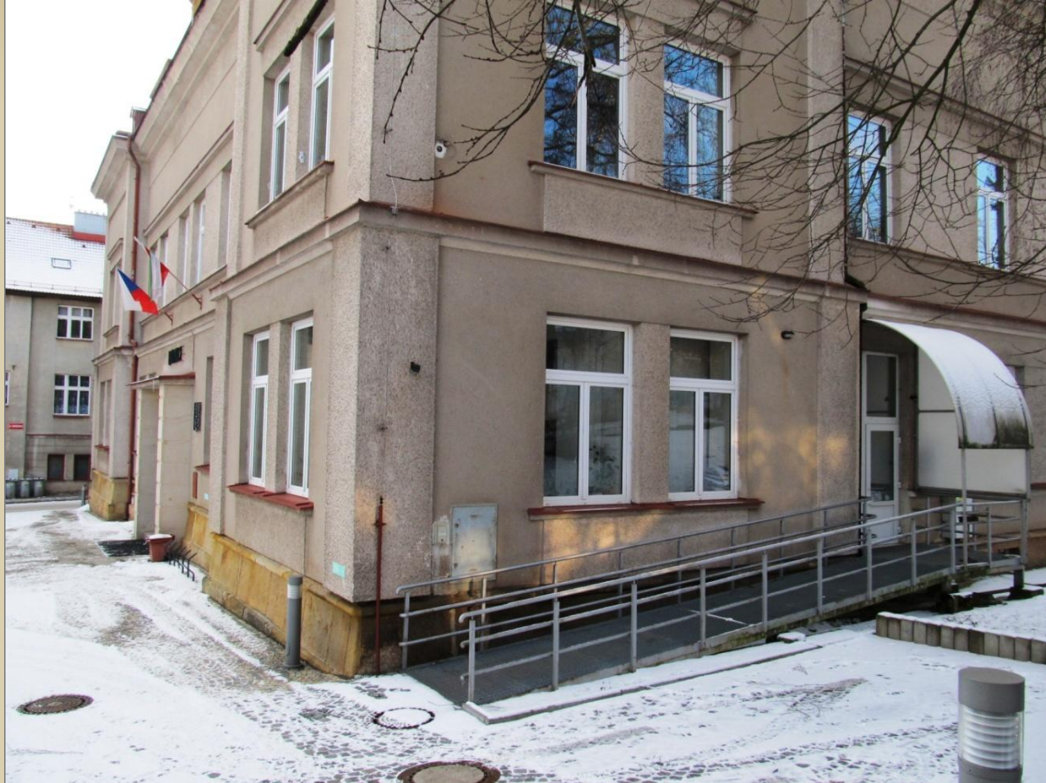
Budova městského úřadu